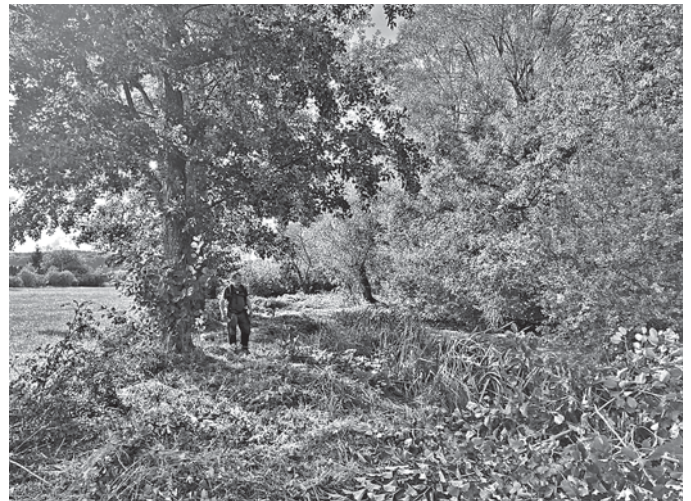
Mäharbeiten an den Röhrachteichen