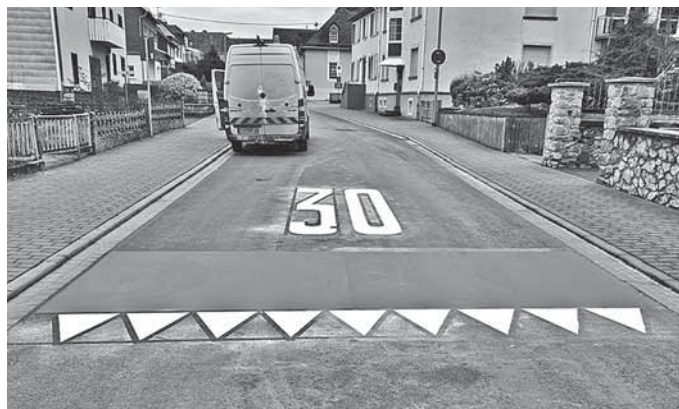
Wann fahren wir nur noch „30“ im Flecken?

Samstag, 30. September 2023, von 09.00 bis 12.00 Uhr in der Hauptstraße an der Bushaltestelle.