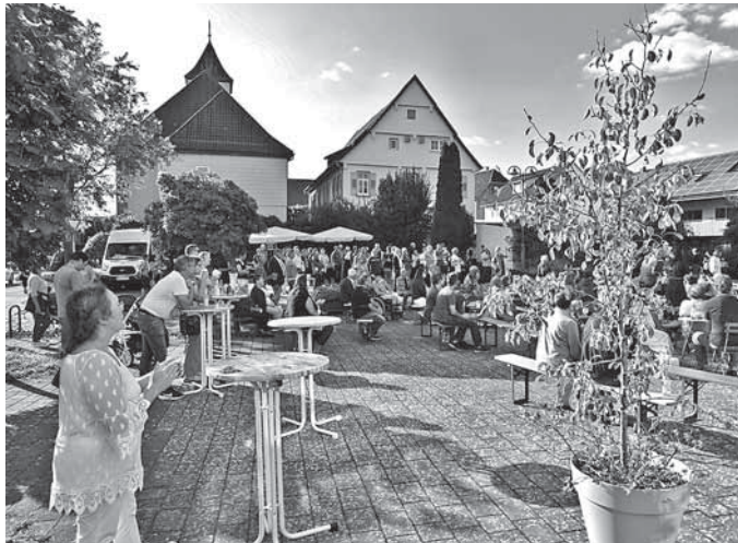
Dorfplatz Kleinaspach mit der Feier für unseren Pfr. Scheld