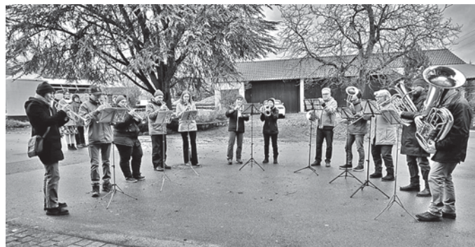
CVJM Posaunenchor beim Adventsblasen auf den Höfen

Wenn ihr die ersten Anzeichen von alldem bemerkt, dann richtet euch auf und erhebt freudig den Kopf: Bald werdet ihr gerettet! Gute Nachricht nach dem Evangelium Lukas Kapitel 21 Vers 28