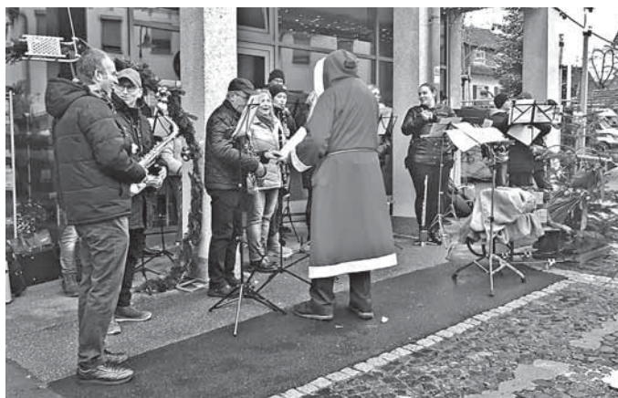
Auch dem Nikolaus hat's gefallen und er hat ein kleines Dankeschön verteilt.

Um 13:30 Uhr ging es dann auf dem Aspacher Weihnachtsmarkt weiter. Die Regenpause setzte glücklicherweise pünktlich ein, sodass wir trocken im Hauptes vor dem Rathaus musizieren konnten. Von „Alle Jahre wieder“ über „Sleigh Ride“, „Feliz Navidad“ bis „Tochter Zion“ hatten wir ein buntes Musikprogramm im Gepäck und unterhielten die Besucher mit weihnachtlichen Klängen. Den Nachmittag ließen wir anschließend bei Punsch und Glühwein vor den Weihnachtsmarktständen gemütlich ausklingen.