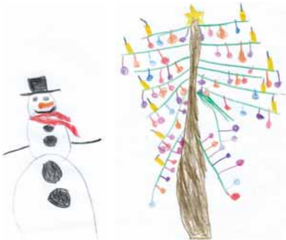
gemalt von Emma, 4 Jahre

Wir haben von einschließlich 22.12.2023 bis 05.01.2024 Betriebsruhe! Ab Montag, 08.01.2024 stehen wir Ihnen wieder mit der gewohnten Zuverlässigkeit zur Verfügung.