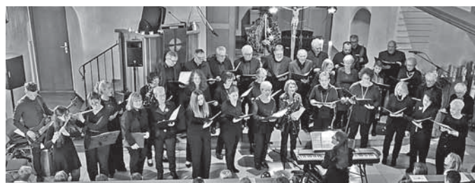
Der gemischte Chor „Cantiamo“